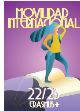
Cartel nº 20

En anexo a esta resolución se publica la relación de obras presentadas, su puntuación y el documento de identidad del participante.