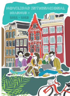
Cartel nº 9

* Primer premio tras el voto de calidad del presidente del jurado. Según bases de la convocatoria.