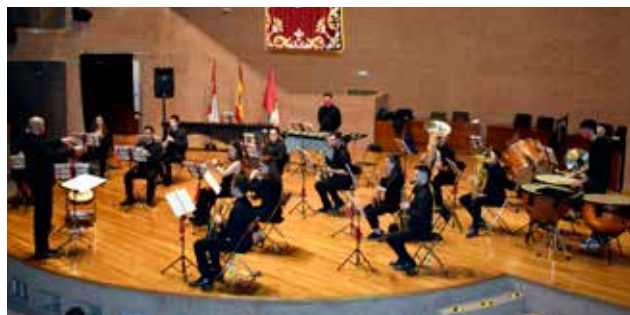
Foto VCDRS.1 Concierto Fin de Curso, Asociación Musical UCLM (Albacete)

Con motivo de la celebración del 8 de marzo se desarrollaron nuevas actividades de sensibilización para avanzar en una igualdad real y efectiva entre mujeres y hombres. En esta ocasión, las iniciativas llevadas a cabo por la UCLM fueron una manifestación virtual «1000 pasos hacia la igualdad» y la convocatoria del I Concurso de microcuentos Día Internacional de la Mujer #microcuentoUCLM8M.