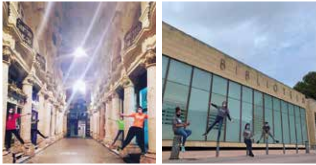
Fotos VCDRS.5 y 6 Premiados en el Programa «Conoce tu Campus y tu Ciudad»

En el ámbito de la creación artística se ha convocado #CreaCIC 2021 (XI Edición de los Concursos Culturales Universitarios) con los ya tradicionales concursos de maquetas musicales, vídeo, fotografía, dibujo e ilustración, relato y poesía. Esta edición se presentaron 113 creadores entre todas las categorías. Como novedad, este año se falló el premio «Estudiantes», elegido en votación popular por los estudiantes que previamente habían solicitado formar parte del proyecto.