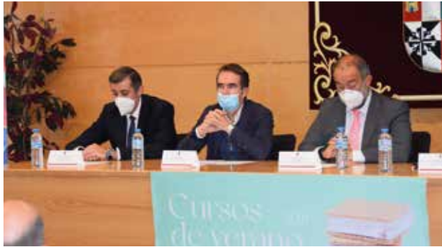
Foto VCDRS.7 Inauguración del Curso de Verano «Digitalización y discapacidad: ¿amenaza u oportunidad?»

Las actividades recreativas, de ocio y salud superaron las 1.200 inscripciones en las actividades programadas durante el curso. La participación estuvo próxima al 100% de las plazas ofertadas, teniendo en cuenta la reducción de aforo. Algunas actividades, normalmente cuatrimestrales, fueron ofertadas durante este curso académico de manera bimestral [Tabla VCDRS.1].