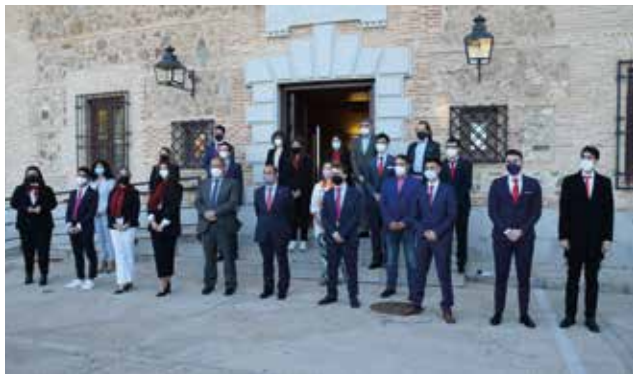
Foto VCDRS.8 Jurado UCLM y equipos participantes en la fase final intercampus de la Liga de Debate Universitario

En cuanto a las actividades competitivas , se convocó en los distintos campus y sedes el XXXI Trofeo Rector en modalidades individuales, reuniendo a un total de 467 deportistas distribuidos en más de 231 equipos y disputándose 632 encuentros [Tabla VCDRS.3]. El programa UCLM eSports se desarrolló en dos modalidades de juego, «League of Legends» y «FIFA21», con una participación de 289 estudiantes y la disputa de 466 partidas [Tabla VCDRS.4]. En la actividad «Conoce tu Campus y tu Ciudad», los participantes completaron distintos itinerarios por los lugares más representativos de cada uno de los campus y de las ciudades, haciendo fotografías en cada uno de ellos. En total, fueron 45 los participantes [Fotos VCDRS.5 y 6].