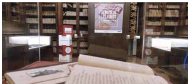
Foto VCDRS.4 Exposición El papel en los libros. Biblioteca Regional de Castilla-La Mancha (Toledo)

El 13 de abril de 2021 se proyectó en todos los campus y sedes de la UCLM El año del descubrimiento , de Luis López Carrasco profesor de nuestra universidad, ganador de un Goya al mejor documental.