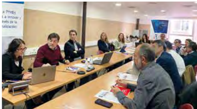
Foto VIEYE.11. VI Jornada «12 meses, 12 retos»

de su colaboración para premios fin de grado o máster, congresos, o la convocatoria de becas de estudios, prácticas o iniciación a la investigación, como es el caso de Repsol, Electroemper, Acciona Construcción, Grupo MAHLE, Eiffage o Aguas de Albacete , entre otras.