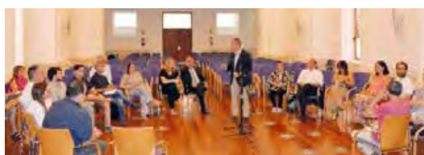
Foto VIEYE.13. Asistentes a la jornada en el Campus de Ciudad Real

torial de Investigación del Grupo 9 de Universidades; el Grupo de Trabajo Open Science de la CRUE; el Consejo Rector de la Agencia de Investigación e Innovación de Castilla-La Mancha; la Fundación Centro Europeo de Empresas e Innovación (CEEI); la Fundación Parque Científico y Tecnológico de Albacete; la Fundación Jardín Botánico de Castilla-La Mancha; el Instituto Técnico Agronómico Provincial -ITAP-; Fundescam (Fundación para el Desarrollo Sostenible de Castilla-La Mancha); vocalía del Consejo Ejecutivo y del Patronato de la Fundación General de la Universidad de Castilla-La Mancha; Secretaría Ejecutiva de la Comisión Sectorial Crue-I+D+i; y como Vicepresidenta del Comité «Por una empresa igual» de la Asociación de Empresarios de la ciudad de Albacete -ADECA-, a cuyas convocatorias se ha atendido a lo largo del curso.