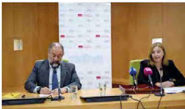
Foto VIEYE.6. Acto presentación Informe Resultados de Transferencia e Innovación 21/22