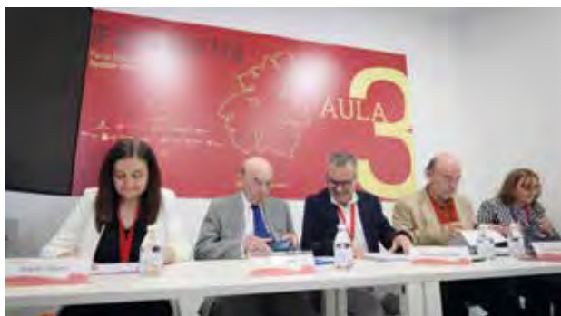
Foto VIEYE.7. Participación UCLM en FENAVIN 2023

agrupa a diversas entidades pertenecientes a redes europeas que, a través de reuniones periódicas, coordinan sus actividades para la promoción y desarrollo del empleo, la movilidad juvenil, el apoyo empresarial, el apoyo a la investigación y la innovación, el emprendimiento y la participación ciudadana.