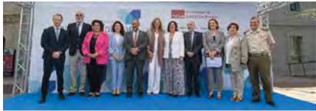
Foto VIEYE.1. Inauguración 17 Ed. Foro de Empleo UCLM3E