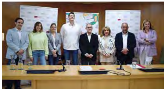
Foto VIEYE.9. Firma convenio con AFANIÓN

miento, para conectar el talento universitario con el mundo empresarial para que ambas partes resulten beneficiadas.