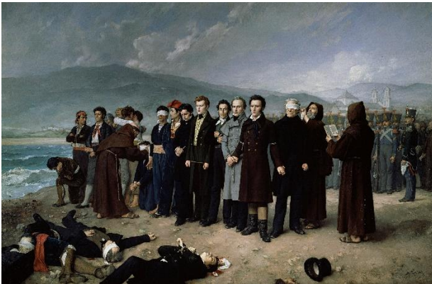
Antonio Gisbert Pérez. Fusilamiento de Torrijos y sus compañeros en las playas de Málaga. Museo del Prado.