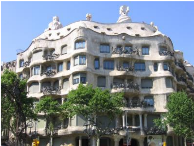
Fig.1 Puntuación máxima. 2 puntos

Analiza y comenta las dos obras de arte presentadas: