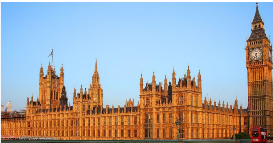
Fig.1 Puntuación máxima. 2 puntos

Analiza y comenta las dos obras de arte presentadas: