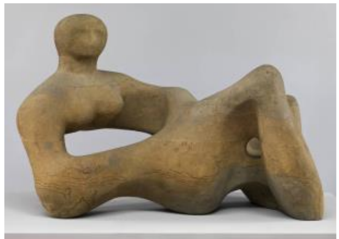
Fig.2 Puntuación máxima. 2 puntos